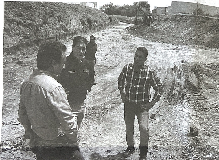
En la gráfica aparece el Presidente Municipal Lic. Francisco Héctor Treviño Cantú supervisando el avance de la Magna Obra Pluvial en la avenida Eloy Cavazos, la cual pondrá fin a las inundaciones que provocaban afectaciones a la comunidad

"Continuaremos trabajando con este tipo de proyectos de obras pluviales, tenemos siempre que estar previniendo por la integridad de los ciudadanos... Y es por ello que seguiremos con este tipo de proyectos de obra pública como son los drenajes pluviales" finalizó Paco Treviño.